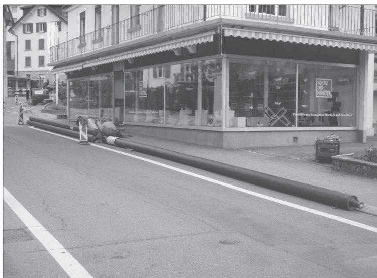
Bereitstellen der Heizleitungen für den Einbau in der Rigistrasse.