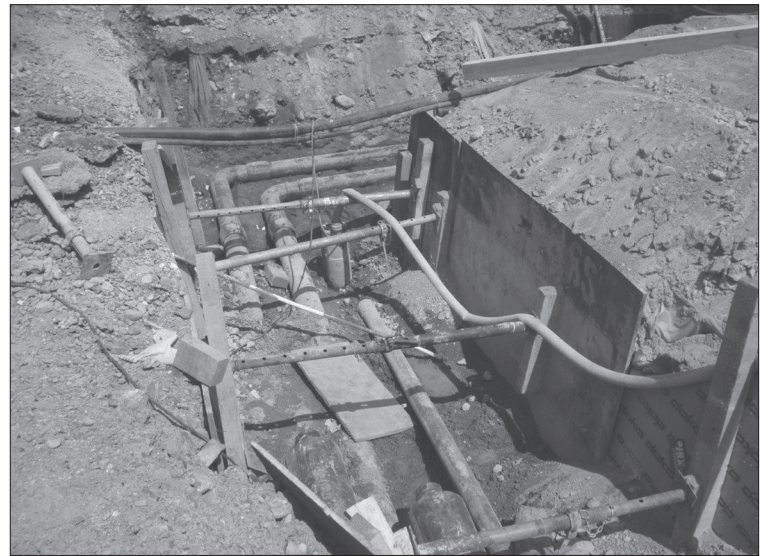
«Leitungssalat» in der Weihermatt.